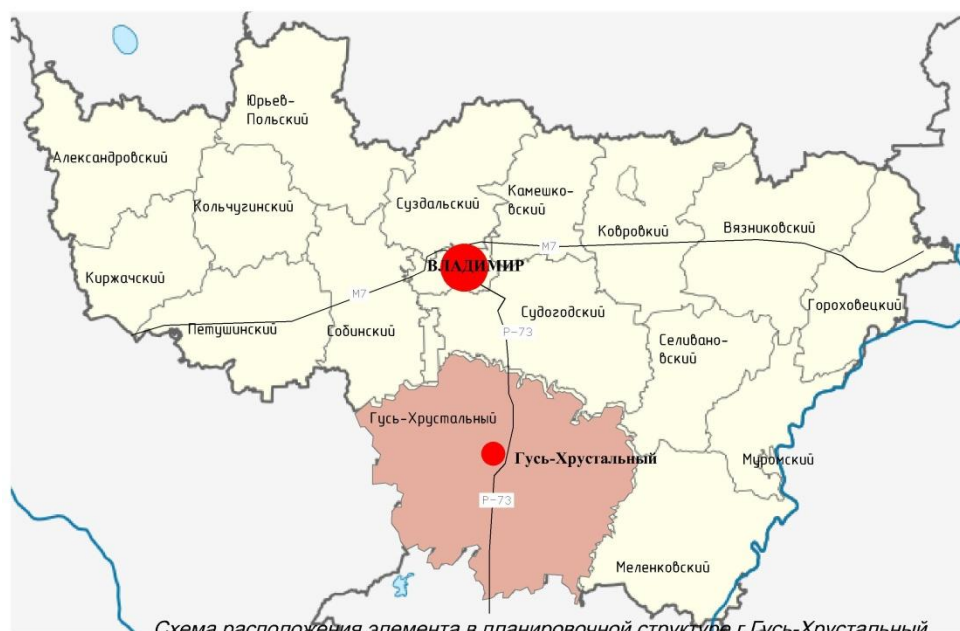
Схема расположения элемента в планировочной структуре г.Гусь-Хрустальный

Схема расположения элемента в планировочной структуре Владимирской области