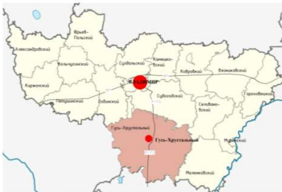
Схема расположения элемента в планировочной структуре г.Гусь-Хрустальный