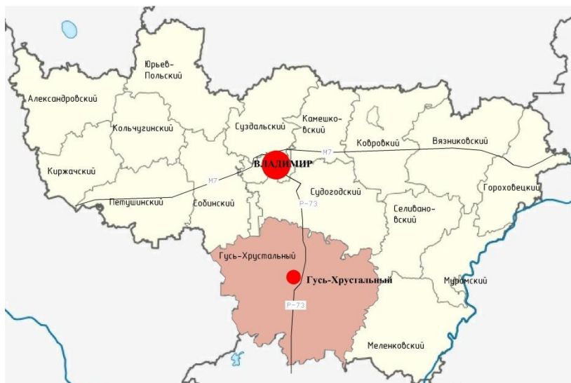
Схема расположения элемента в планировочной структуре г.Гусь-Хрустальный

Схема расположения элемента в планировочной структуре Владимирской области